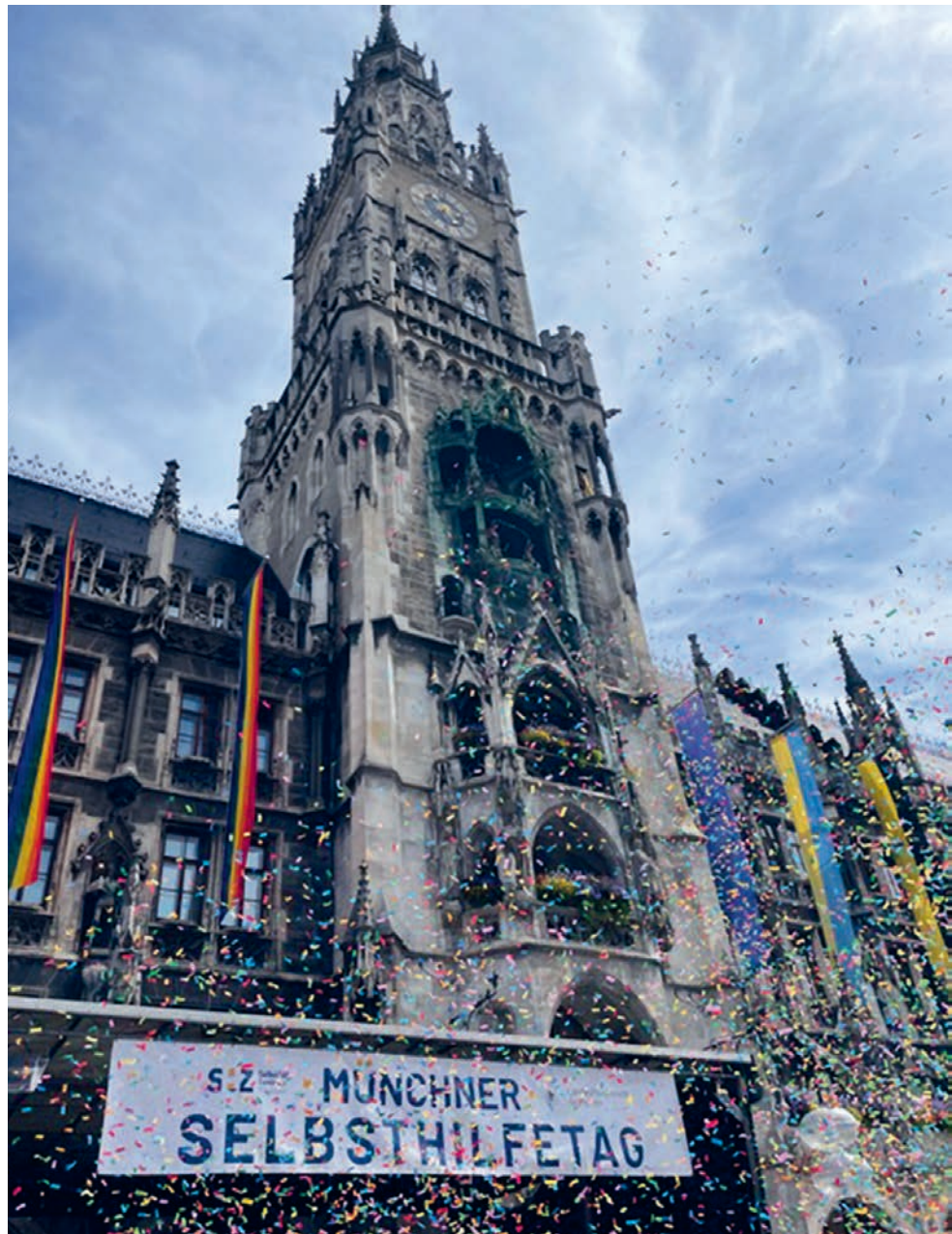
Der Selbsthilfetag findet alle zwei Jahre statt.

Das Spektrum der Selbsthilfegruppen ist vielfältig und reicht von gesundheitsbezogenen Themen wie chronische und psychische Erkrankungen, Behinderung oder Sucht bis hin zu sozialen Themen wie Arbeitslosigkeit, Einsamkeit oder Migration. An vier Tagen pro Woche beraten wir in unserer Beratungs- und