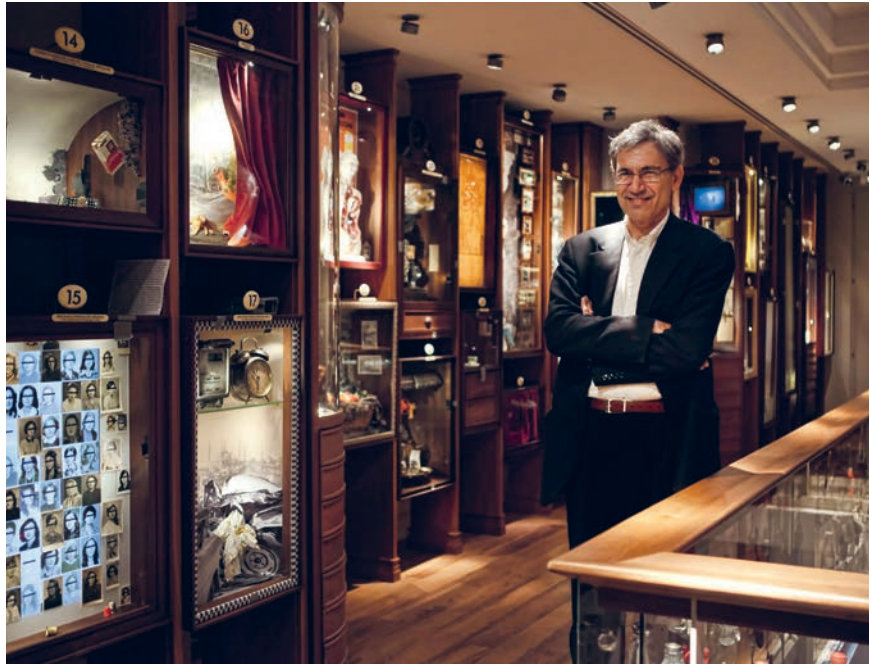
Orhan Pamuk in seinem Museum der Unschuld, Istanbul

Noch bis zum 13. Oktober zeigt das Lenbachhaus Bilder von Orhan Pamuk (*1952 in Istanbul). Der erste türkische Schriftsteller, der den Literaturnobelpreis erhielt, präsentiert dort sein vielseitiges Schaffen als Autor, Fotograf, Zeichner, Kurator, Museumsgründer und bedeutende politische Stimme unserer Gegenwart.