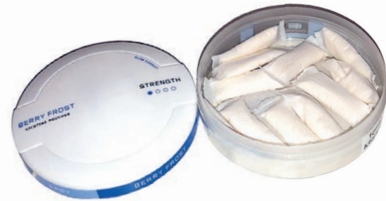
Tabakfreie Nikotinbeutel mit Beeren-Aroma.

Die Ergebnisse zeigen , dass der Konsum von 30-Milligramm-Nikotinbeuteln zu einer höheren Nikotinaufnahme im Vergleich zur Zigarette führte (Cmax: 29,4 vs. 15,2 ng/mL; AUC: 45,7 vs. 22,1 ng/mL × h). Die Nikotinaufnahme in der akuten Phase erfolgte sowohl bei der Verwendung des 30-Milligramm-Beutels als auch bei der Zigarette sehr schnell. Die Extraktionsrate des Nikotins variierte zwischen den Beuteln. Alle getesteten Produkte reduzierten das