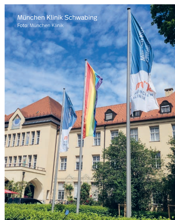
München Klinik Schwabing