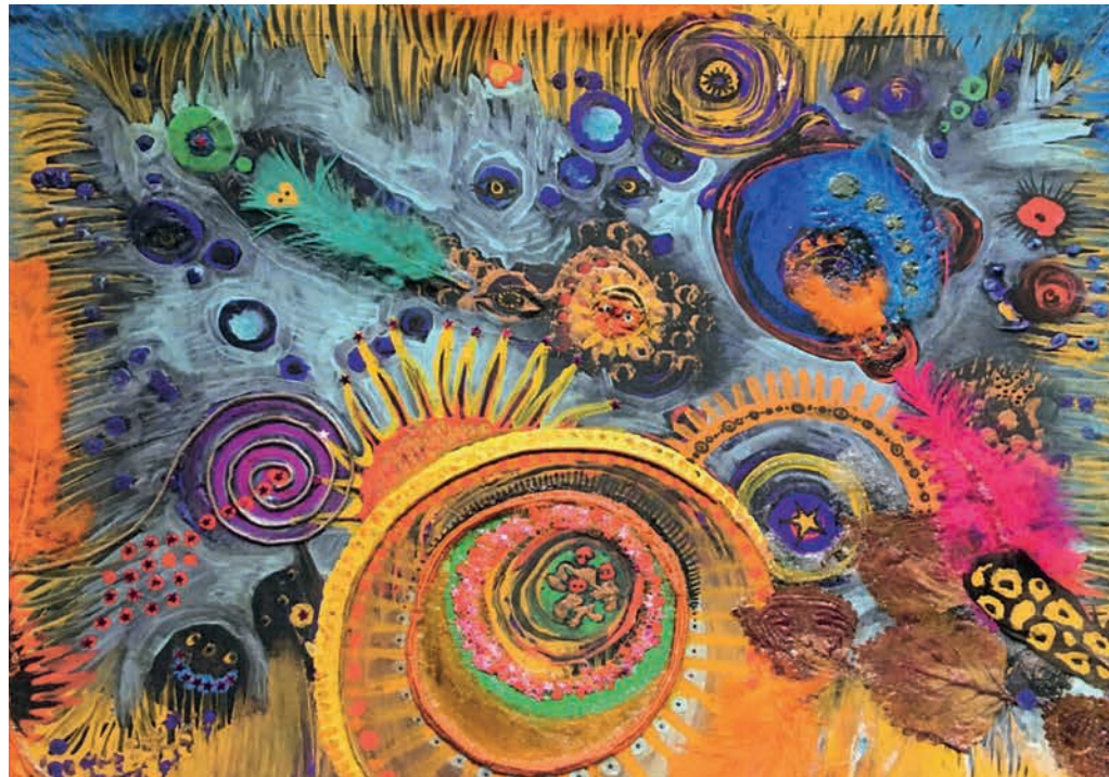
Die diesjährige Geburtstagskarte, die die MüPE an ihre Mitglieder verschickt.

Die Peer-to-Peer-Beratung von Betroffenen für Betroffene ist unser Hauptanliegen, sozusagen unser Kerngeschäft. Weil wir selbst betroffen sind, können wir andere unterstützen. Zum Beispiel geben wir