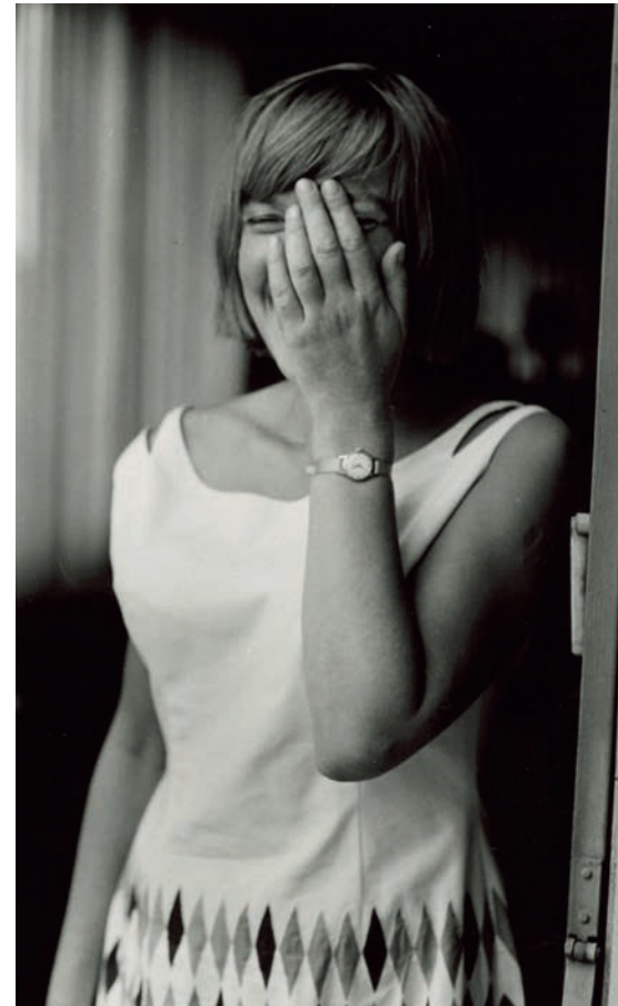
Ingeborg Bachmann in Rom, 1962