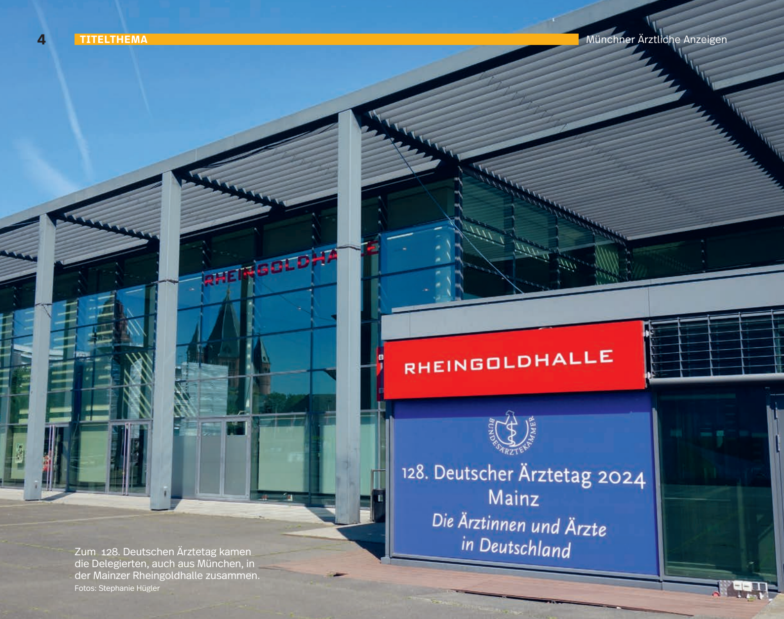
Zum 128. Deutschen Ärztetag kamen die Delegierten, auch aus München, in der Mainzer Rheingoldhalle zusammen.