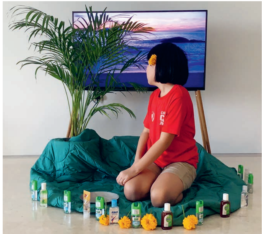
Foto: Cao Fei, Isle of Instability, 2020, Video / Installation, Single-channel HD video, color with sound © Cao Fei, 2024. Courtesy Sprüth Magers and Vitamin Creative Space, Audemars Piguet Contemporary 2024. Courtesy Sprüth Magers and Vitamin Creative Space