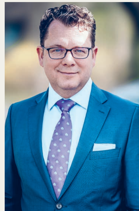
Nicolas von Oppen