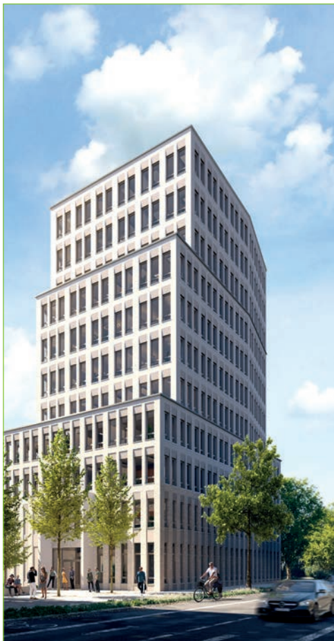
© Visualisierung, Urheber: renderfriends, Quelle: S&P Commercial Development

Anästhesiepraxis in München sucht Facharzt (m/w/d) zur Anstellung in Teilzeit. Angenehmes Arbeitsklima, nur ambulante Tätigkeit, keine Nacht- und Wochenenddienste, Praxiseinstieg bzw. Übernahme zum späteren Zeitpunkt möglich; ideal zum Neustart z.B. nach Elternzeit Bewerbung gerne per Mail an: AnaesthesiaMuenchen1@web.de