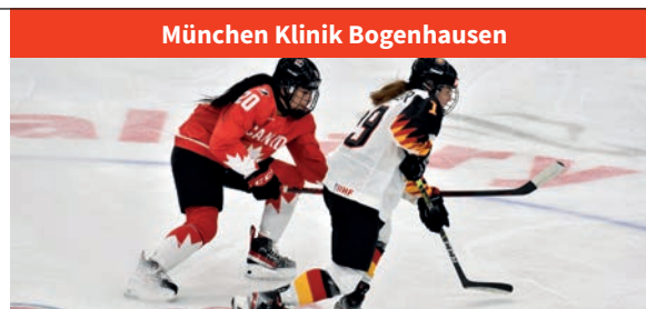
München Klinik Bogenhausen

High-end-Therapie der Depression ⌚ 16:00 bis 17:30, 2 CME-Punkte Hybride Veranstaltung, bit.ly/3SzP7W5, Ort: kbo-Isar-Amper-Klinikum Region München, E.19, Ringstr. 4 / Haus 4, 85540 Haar, Veranstalter: kbo-Isar-Amper-Klinikum Region München, Verantwortlicher: Prof. Dr.