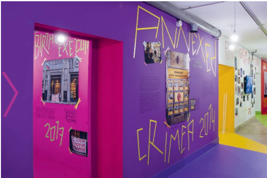
Ausstellungsansicht – Haus der Kunst München, 2024