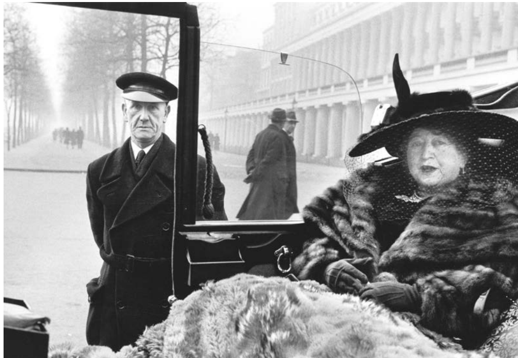
USA. New York, NY. A Llama in Times Square. 1957.