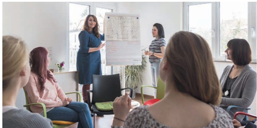
Therapiealltag im TCE