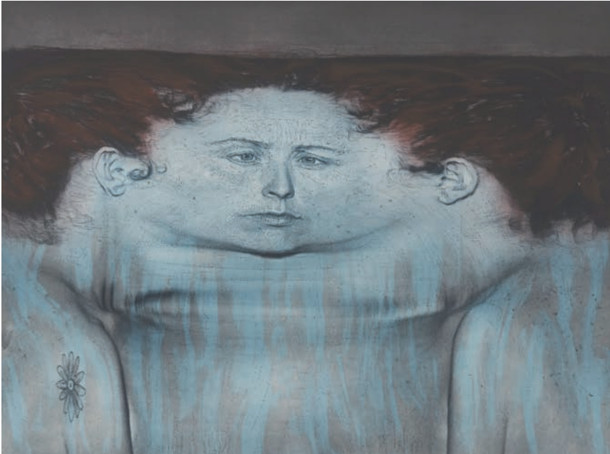
Kiki Smith: My Blue Lake. Staatliche Graphische Sammlung München, Schenkung der Künstlerin © Kiki Smith, courtesy Pace Gallery

Noch bis zum 26. Mai 2019 zeigt die Staatliche Graphische Sammlung München in der Pinakothek der Moderne die Ausstellung „TOUCH. PRINTS“ mit Druckgrafiken von Kiki Smith. Zu sehen sind über 160 ausgewählte Werke aus einer umfangreichen Schenkung - von 1985 bis heute. Gegliedert sind sie nach thematischen Aspekten: Das Entree empfängt mit Motiven aus der Welt zwischen Leben und Tod, die Folgeräume sind überschrieben mit „Die Welt des menschlichen Körpers“ und „In der weißen Zelle“.