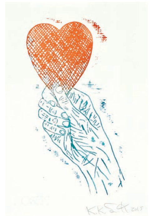
Kiki Smith: Heart in Hand.