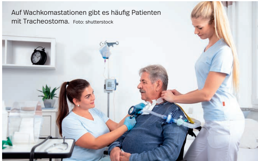
Auf Wachkomastationen gibt es häufig Patienten mit Tracheostoma.

Auf der Apallikerstation werden die Menschen sehr gut betreut, auch medizinisch. Ich bin dort einmal im Monat, bei wichtigen, akuten Problemen auch öfter. Unter anderem kommt in diese ambulante Einrichtung auch regelmäßig ein Beatmungsmediziner. Es gibt auf dieser Station zehn Wachkomapatienten mit Dysphagie bei absaugpflichtigem Tracheostoma. Insgesamt wohnen dort derzeit 20 Patienten mit