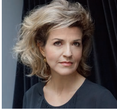
Anne-Sophie Mutter ist Schirmherrin.

Der Erlös des Konzerts fließt in die Förderstiftung „Bayern gegen Krebs“, mit der die Bayerische Krebsgesellschaft krebserkrankten Menschen in Bayern neue Perspektiven eröffnen will. Karten gibt es zu 20/30/40 Euro