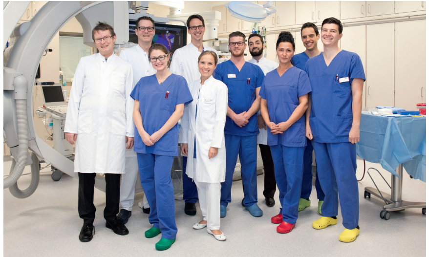
Das Kardiologieteam am Rotkreuzklinikum München.

Immer wenn neue digitale Technologien in die Leitlinien übernommen werden, gibt es dazu Studien. Die Druckdrahtmessung etwa wurde in eine solche Leitlinie übernommen, weil hiermit Läsionen identifiziert werden konnten, deren Behandlung nachweislich von prognostischer Bedeutung sind. Es gibt zusätzlich viele nicht leitlinienrelevante Studien, die die Vorteile der Technik klar beschreiben: die Reduktion der OP-Zeit, der Strahlenexposition, die Trainierbarkeit und Erhöhung der Sicherheit für den Patienten