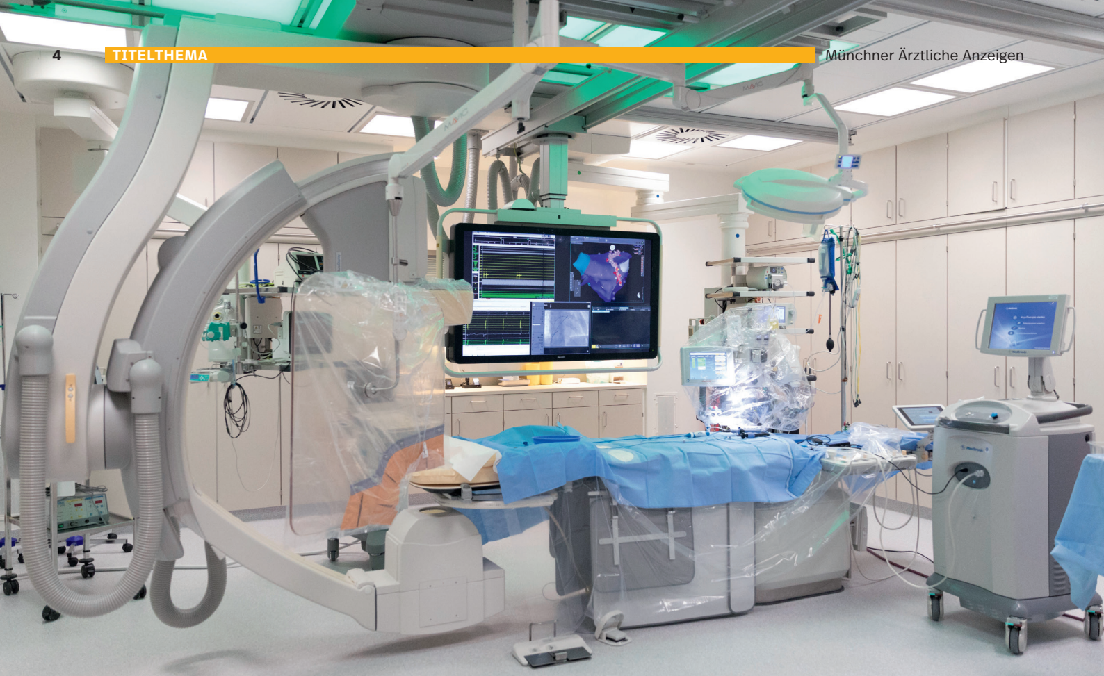
Das Herzkatheterlabor ist voll durchdigitalisiert.