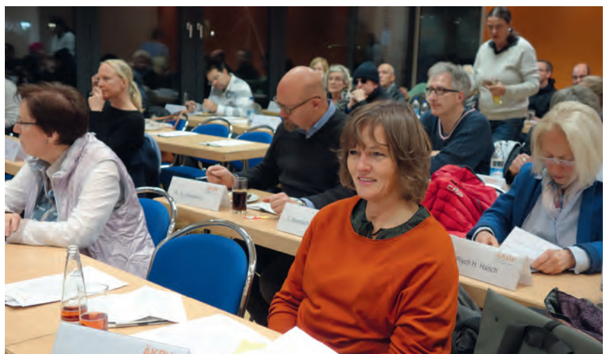
Die Vorträge stießen auf reges Interesse bei den Delegierten.