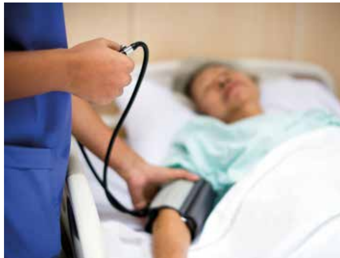
Pflegerin beim Blutdruckmessen.

Natürlich müsste man ein solches Programm wie das von mir vorgeschlagene für eine begrenzte Zeit, also z. B. für die nächsten drei Jahre, konzipieren, und seine Wirkung währenddessen wissenschaftlich evaluieren. Und natürlich kann man ein solches System nicht auf Dauer finanzieren, sondern es muss sich irgendwann selbst tragen. Wir möchten auch nicht dauernd mit Prämien arbeiten, sondern wollen langfristig die Rahmenbedingungen in der Pflege so verbessern, dass es wieder mehr Pflegende gibt. Die Rahmenbedingungen in der Pflege haben sich ja deshalb so existentiell verschlechtert, weil zu häufig Pflegestellen im Rahmen von Kosteneinsparungen reduziert wurden.