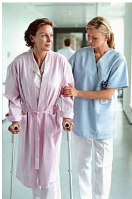
Pflegerin mit Patientin.