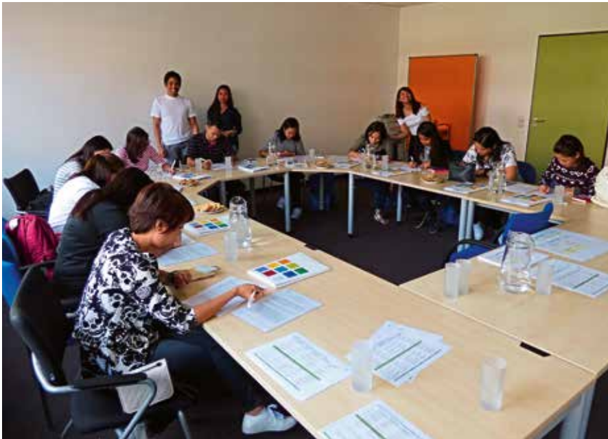
Die philippinischen Pflegekräfte erhalten von ihren neuen Kolleginnen und Kollegen Unterstützung.

Aus 12.000 Kilometern Entfernung landeten am 22. Mai elf ausgebildete Pflegekräfte mit mehrjähriger Berufserfahrung am Flughafen München. Bevor sie in den Berufsalltag im Städtischen Klinikum München starten, erhalten sie eine vierwöchige Einführung – insgesamt ist das Integrationsprogramm langfristig angelegt. Die Auslandsakquise ist für die städtischen Kliniken eine wichtige Maßnahme zur Sicherung des pflegerischen Fachpersonals.