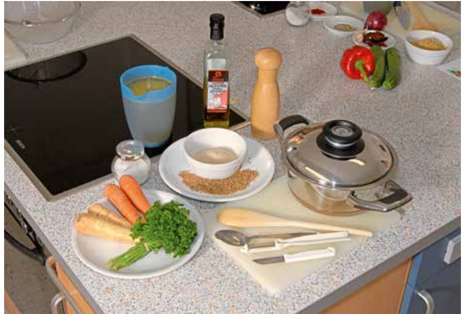
In der Lehrküche des KoKoNat kommt ballaststoffreiche Nahrung auf den Tisch.

Sie haben eben schon einige konkrete Maßnahmen genannt, wie etwa den Ölwechsel und den Schrittzähler. Was sollte noch konkret geschehen?